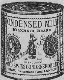
Facsimil de la lata de leche marca "La Lechera"

A los señores Médicos, Hospitales, Comerciantes, Madres de familia, y al público en general.